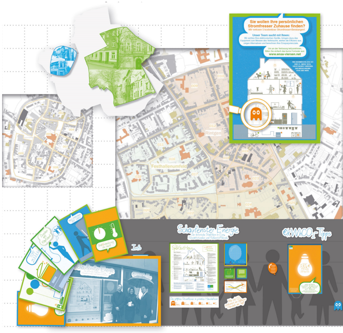
Abbildung 2: Praxisbeispiel Historischer Ortskern Dülken - Printkampagne (Grafik: Jung Stadtkonzepte)